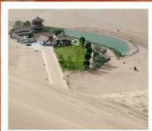
เขื่อนทรายหมิงซาซาน