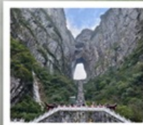
เขากียนเหมินซาน