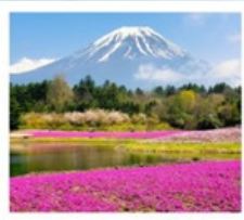
ทะเลสาบโมโตสุ ทุ่งพังกุ่มอส