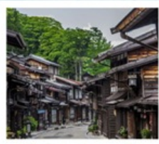
หมู่บ้านโบราณนารายิ จุกุ