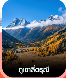
ภูเขาสัตรีณี

คอนเฟิร์ม ออกเดินทาง ทุกพีเรียด 2 ท่านขึ้นไป