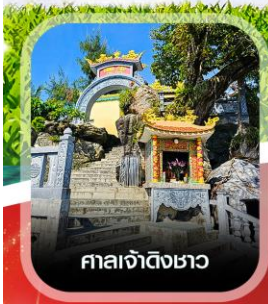
ศาลเจ้าดิ้งเซา