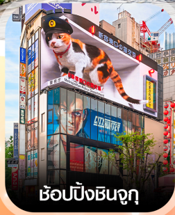
ซ้อปิ้งชินจูกุ