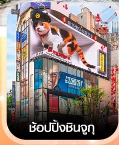
ซ้อปังชินจูกุ