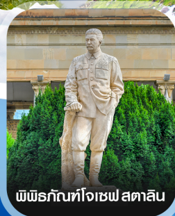
พิพิธภัณฑ์โจเซฟ สตาลิน

คอนเฟิร์มออกเดินทาง ทุกพีเรียด 2 ท่านขึ้นไป