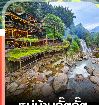
หมู่บ้านก๊วกก๊วก