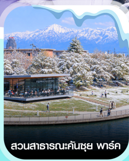
สวนสาธารณะคันซุย พาร์ค