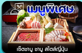
เช็ตซาบู ซาบู สีสต์ญี่ปุ่น