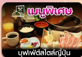
บุฟเฟ่ต์อาหารเช้าญี่ปุ่น

ซัปโปโร-ชมทุ่งดอกลาเวนเดอร์-โทมิตะฟาร์ม-ชิชิโนะโอะกะ-น้ำตกชิราอิเกะ-บ่อน้ำสีฟ้า-อีสระะซ็อบบั้งเต็มวัน-ฟักออนเซน