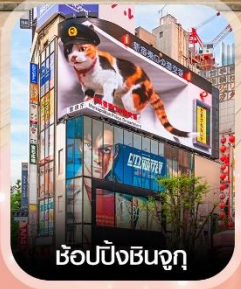
ซ้อปิ้งชินจูกุ

✈️ คอนเฟิร์ม ออกเดินทาง ทุกพีเรียด 2 ท่านขึ้นไป