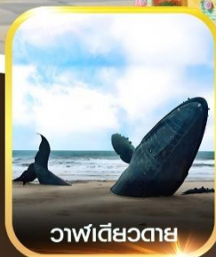
วาฬเดี่ยวตาย

คอนเฟิร์มออกเดินทาง ทุกพีเรียด 2 ท่านขึ้นไป