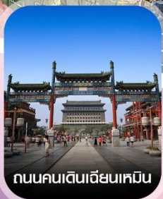
ถนนคนเดินเฉียนเหมิน

✈️ คอนเฟิร์มออกเดินทาง ทุกพีเรียด 2 ท่านขึ้นไป