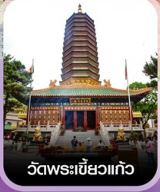
วัดพระเขี้ยวแก้ว