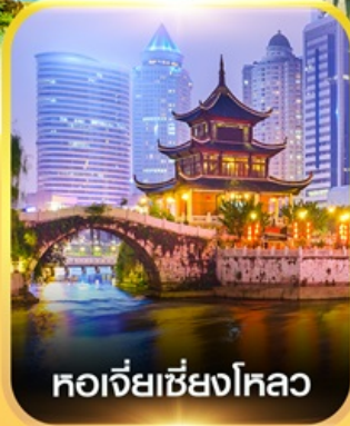
หอเจียเซียงโหลว