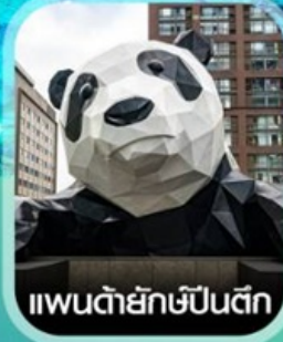
แพนด้ายักษ์ป็นตึก