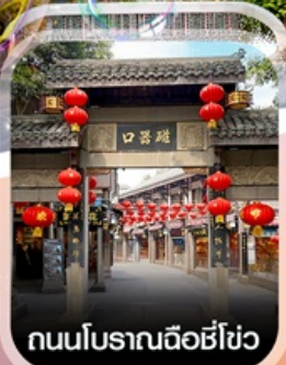
ถนนโบราณฉือชี่โฮว