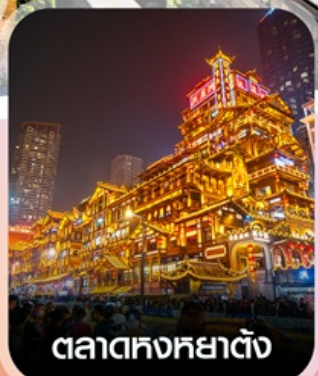
ตลาดหงหย่าตั้ง