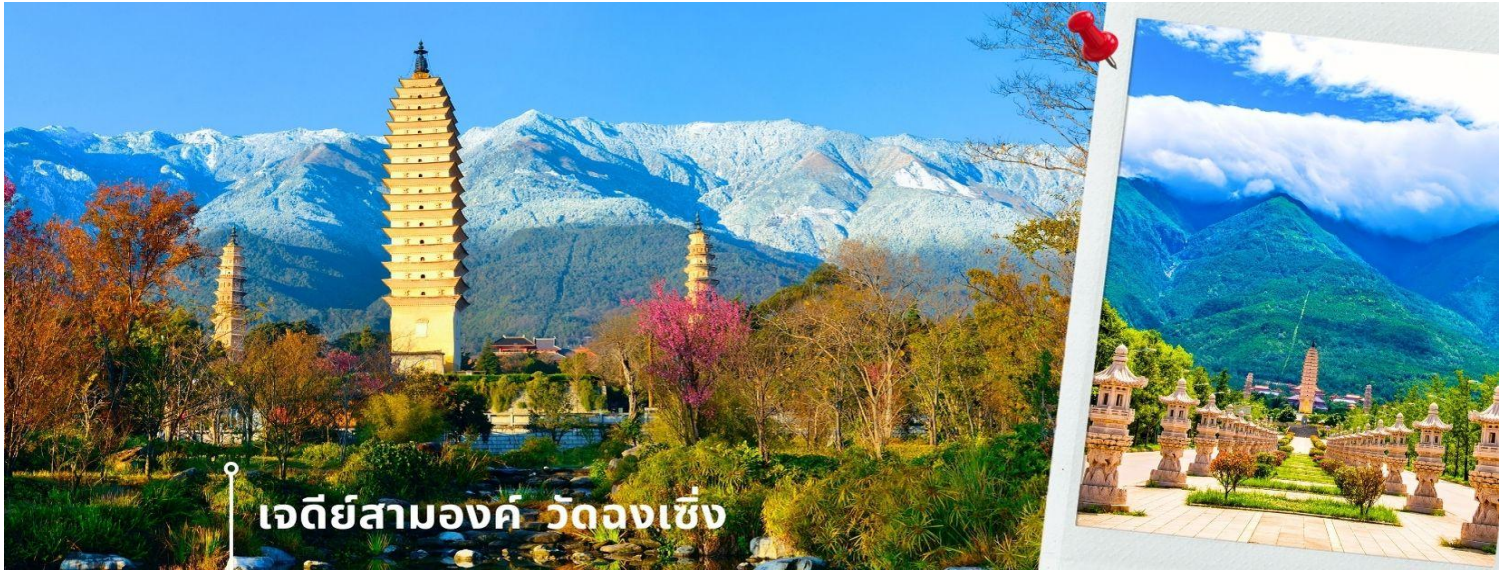
เจดีย์สามองค์ วัดฉงเซิ่ง

จากนั้นผ่านชม เจดีย์สามองค์ สัญลักษณ์ของเมืองต้าหลี่ ตั้งอยู่ใน วัดฉงเซิ่ง (Chongsheng Temple) วัดเก่าแก่ที่สร้างขึ้นเมื่อศตวรรษที่ 9 นับว่าเป็นหนึ่งในเจดีย์ที่สูงที่สุดในประเทศจีน อีกทั้งยังมีความศักดิ์สิทธิ์เป็นอย่างมาก ว่ากันว่าเป็นหนึ่งในสิ่งก่อสร้างเพียงไม่กี่แห่งที่ไม่ถูกทำลายจากเหตุการณ์แผ่นดินไหวในเมืองต้าหลี่เมื่อปี ค.ศ. 1925 จึงกลายเป็นสถานที่เคารพศรัทธาของชาวต้าหลี่เป็นอย่างมาก