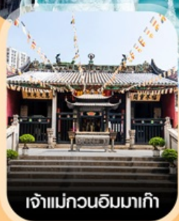
เจ้าแม่กวนอิมมาเก๊า

คอนเฟิร์ม ออกเดินทาง ทุกพีเรียด 2 ท่านขึ้นไป