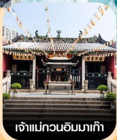
เจ้าแม่กวนอิมมาเก๊า

คอนเฟิร์มออกเดินทาง ทุกพีเรียด 2 ท่านขึ้นไป