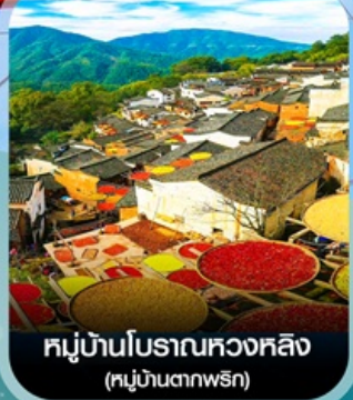
หมู่บ้านโบราณหวงหลิง (หมู่บ้านตากพรัก)