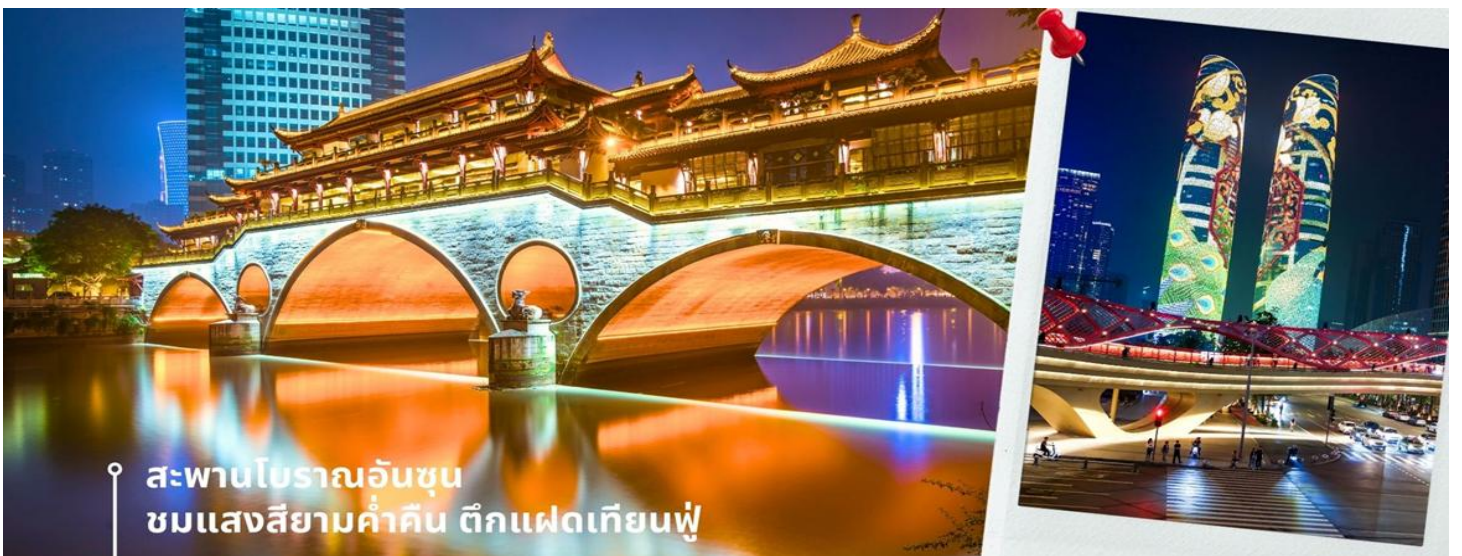
สะพานโบราณอันชุน ชมแสงสียามค่ำคืน ตึกแฝดเทียนฟู่

นำท่านเดินทางเข้าที่พัก AC HTL MARRIOTT 4 ดาวหรือเทียบเท่า