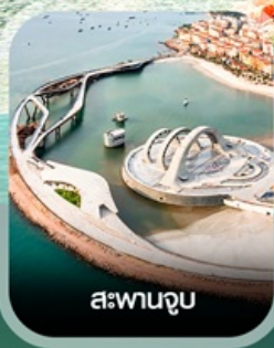
สะพานจูป