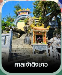
ศาลเจ้าดิงขาว