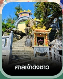
ศาลเจ้าดิ้งซาอว