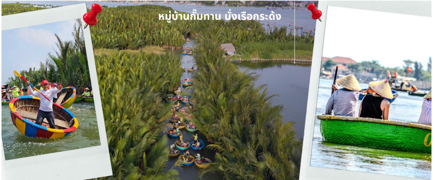
หมู่บ้านกัมทาน นั่งเรือกระดัง

จากนั้นนำท่านผ่านชม ภูเขาหินอ่อน Marble Mountains นำท่านเดินทางสู่ หมู่บ้านกัมทาน สนุกสนานไปกับการเล่นกิจกรรม นั่งเรือกระดัง เป็นหมู่บ้านเล็กๆในเมืองฮอยอันตั้งอยู่ในสวนมะพร้าวริมแม่น้ำ ในอดีตช่วงสงครามที่นี่เป็นที่พักอาศัยของเหล่าทหาร อาชีพหลักของคนที่นี่คืออาชีพประมง ระหว่างการล่องเรือท่านจะได้ชมวัฒนธรรมอันสวยงาม ชาวบ้านจะขับร้องเพลงพื้นเมือง ผู้ชายกับผู้หญิงจะหยอกล้อกันไปมาหน้าที่พายเรือมาเคาะกันเป็นจังหวะดนตรีสุดสนุกสนาน จากนั้นนำท่านเดินทางสู่ เมืองโบราณฮอยอัน เทียบชมเมืองมรดกโลก