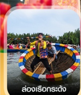
ล่องเรือกระดิ่ง

✈️ คอนเฟิร์มออกเดินทาง ทุกพีเรียด 2 ท่านขึ้นไป