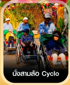
นั่งสามล้อ Cyclo