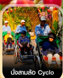
นั่งสามล้อ Cyclo