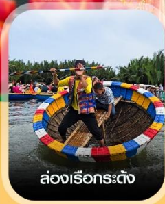
ล่องเรือกระดิ่ง

✈ คอนเฟิร์ม ออกเดินทาง ทุกพีเรียด 2 ท่านขึ้นไป