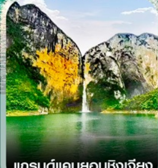
แกรนด์แคนยอนซิงเจี๋ย