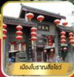
เมืองโบราณลือซื่อ