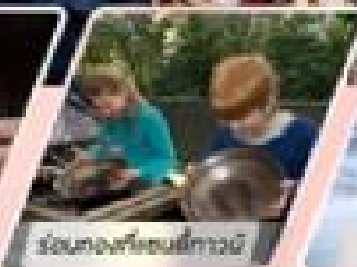
ร่วมแสดงศิลปะชนาเมารี