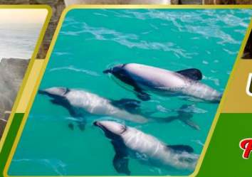
ล่องเรือชมโลมา