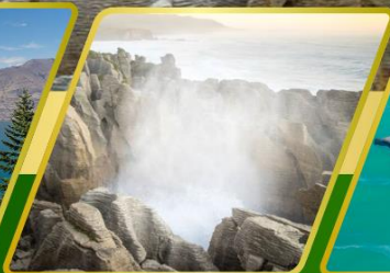
ไปโฮ, แพนเค็กหรือค