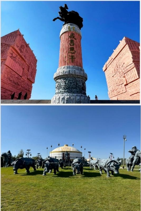
เขตท่องเที่ยวเจงกิสข่าน • กลุ่มประติมากรรม กองทัพเหล็กและกระโจมทอง