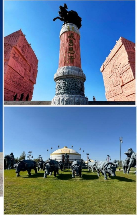
เขตท่องเที่ยวเจงกิสข่าน • กลุ่มประติมากรรม กองทัพเหล็กและกระโจมทอง

บ่าย จากนั้นนำท่านตามรอยเท้าของมหาบุรุษผู้ยิ่งใหญ่ "เจงกิสข่าน" (Genghis Khan) นำท่านชม เขตท่องเที่ยวเจงกิสข่าน (Genghis Khan Tourist Area, 成吉思汗旅游区) ซึ่งเป็นสถานที่สำคัญทาง ประวัติศาสตร์ และวัฒนธรรมที่ตั้งอยู่ในเมืองเอ้อเอ๋อร์ตัวซือ (Ordos) เขตปกครองตนเองมองโกเลียในประเทศจีน ที่นี่ไม่เพียง เป็นสถานที่รำลึกถึงเจงกิสข่าน แต่ยังเป็นศูนย์รวมประสพการณ์ที่จะพาคณย้อนเวลากลับไปสู่ยุครุ่งเรือง ของชนเผ่า มองโกล ชมหนึ่งในไฮไลต์ กลุ่มประติมากรรม กองทัพเหล็กและกระโจมทอง (铁马金帐群雕) จำลองภาพ กองทัพ ของเจงกิสข่านและขบวนทัพออกศึกได้อย่างสมจริง แสดงถึงความแข็งแกร่ง แสนยานุภาพและวินัยของ กองทัพ มองโกลผู้พิชิตโลก คุณจะรู้สึกราวกับได้ยืนอยู่ท่ามกลางประวัติศาสตร์อันยิ่งใหญ่