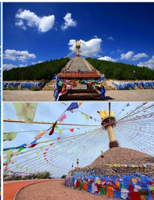
อี้เค่อโอบโ (Great Obla, 伊克敖包)