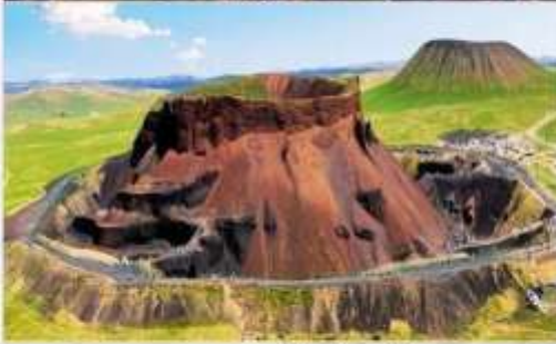
อุทยานภูเขาไฟอูลันฮาตา (Wulanhada Volcano Geopark)