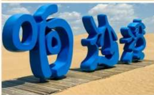
ทะเลทรายเสียงซาวาน