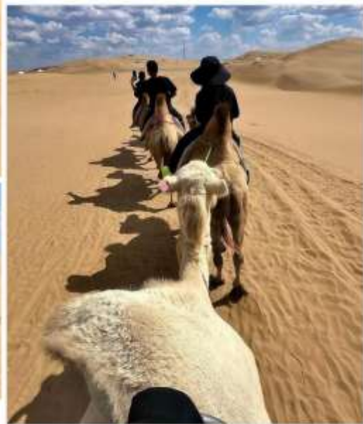
พิเศษ...ขี่อูฐ (รวมค่าขี่อูฐ) สัมผัสประสบการณ์การเดินทางแบบดั้งเดิม

เดินไปตามเนินทราย ชมวิวทะเลทรายอันกว้างใหญ่สุดลูกหูลูกตา จากนั้นท่าน สามารถเลือกซื้อกิจกรรมเสริมเล่นบน ทะเลทรายได้ดังนี้