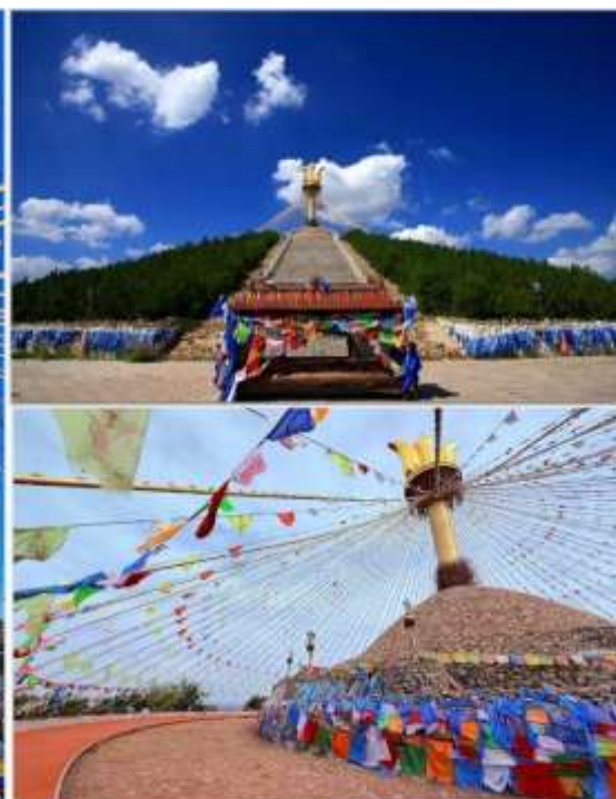
อี้เค่อโอโอบ (Great Obelisk 伊克敖包)