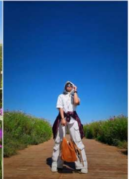
ทุ่งหญ้าออร์ดอส (Ordos Prairie)