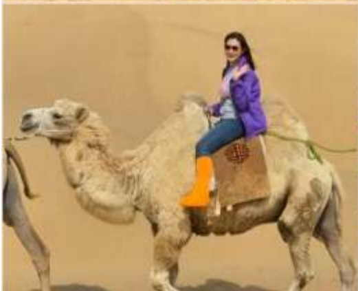
พิเศษ...ขี่อูฐ (รวมค่าขี่อูฐ) สัมผัสประสบการณ์การเดินทางแบบดั้งเดิม