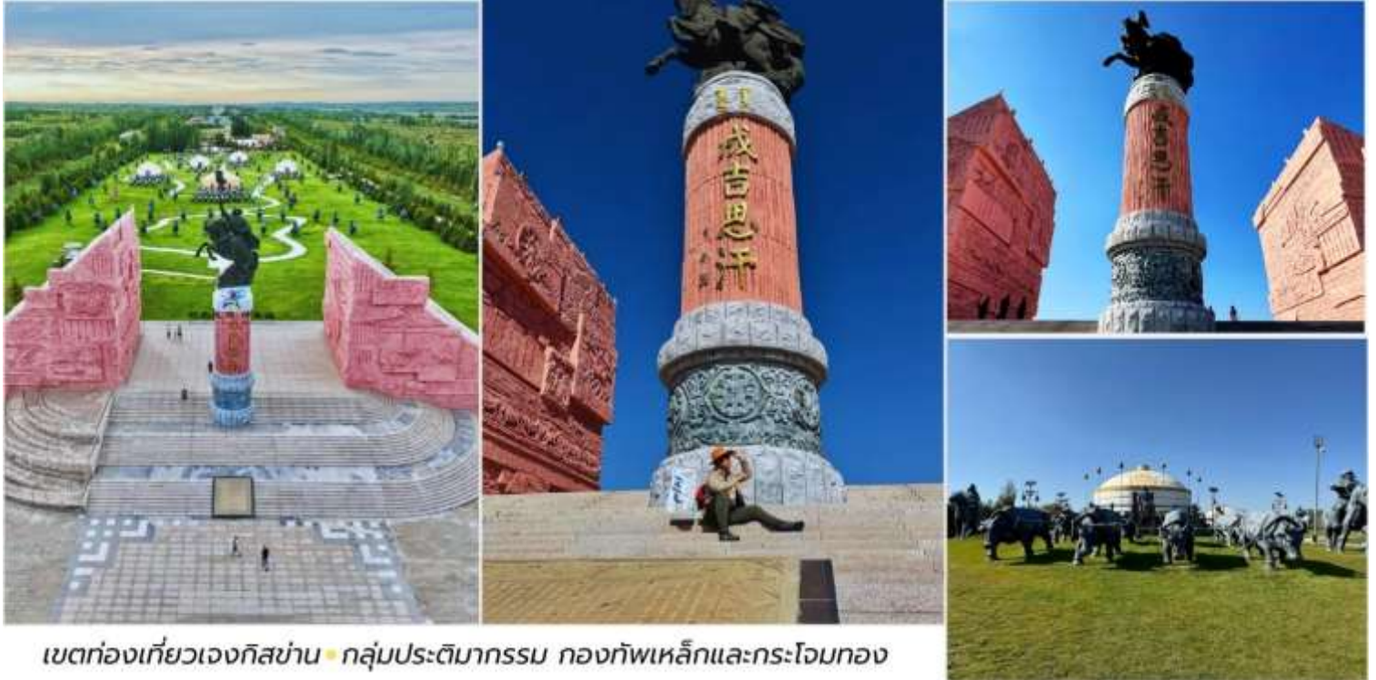
เขตท่องเที่ยวเจงกิสข่าน • กลุ่มประติมากรรม กองทัพเหล็กและกระโจมทอง

บาย จากนั้นนำท่านตามรอยเท้าของมหาบุรุษผู้ยิ่งใหญ่ "เจงกิสข่าน" (Genghis Khan) นำท่านชม เขตท่องเที่ยวเจงกิสข่าน (Genghis Khan Tourist Area, 成吉思汗旅游区) ซึ่งเป็นสถานที่สำคัญทาง ประวัติศาสตร์ และวัฒนธรรมที่ตั้งอยู่ในเมืองเอ้อเอ๋อร์ตัวซือ (Ordos) เขตปกครองตนเองมองโกเลียในประเทศจีน ที่นี่ไม่เพียง เป็นสถานที่รำลึกถึงเจงกิสข่าน แต่ยังเป็นศูนย์รวมประสพการณ์ที่จะพาคุณย้อนเวลากลับไปสู่ยุครุ่งเรือง ของชนเผ่า มองโกล ชมหนึ่งในไฮไลท์ กลุ่มประติมากรรม กองทัพเหล็กและกระโจมทอง (铁马金帐群雕) จำลองภาพ กองทัพ ของเจงกิสข่านและขบวนทัพออกศึกได้อย่างสมจริง แสดงถึงความแข็งแกร่ง แสนยานุภาพและวินัยของ กองทัพ มองโกลผู้พิชิตโลก คุณจะรู้สึกราวกับได้ยืนอยู่ท่ามกลางประวัติศาสตร์อันยิ่งใหญ่