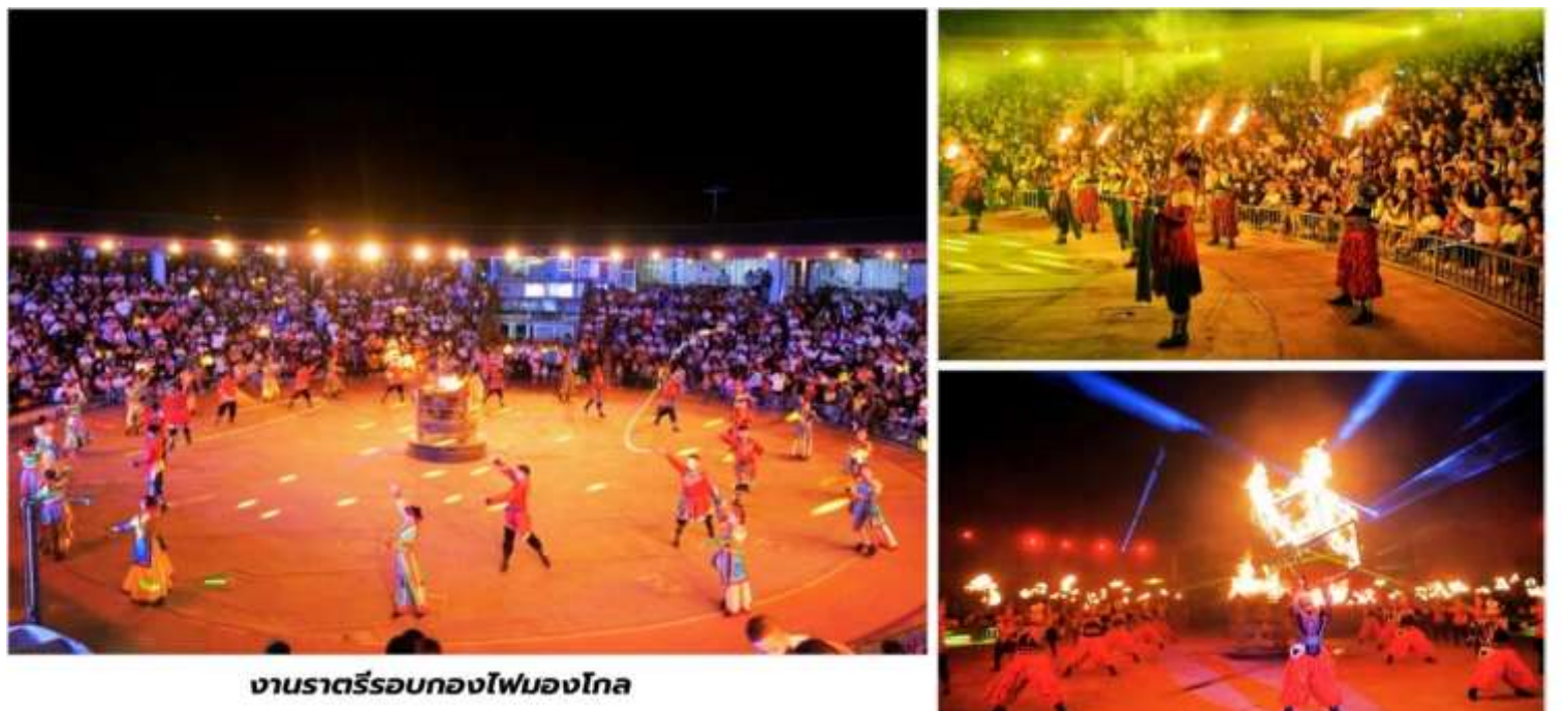
งานราตรีรอบกองไฟมองโก

*หมายเหตุ อัตราค่าบริการอาจมีการเปลี่ยนแปลง โปรดตรวจสอบ ณ จุดจำหน่ายบัตรอีกครั้ง