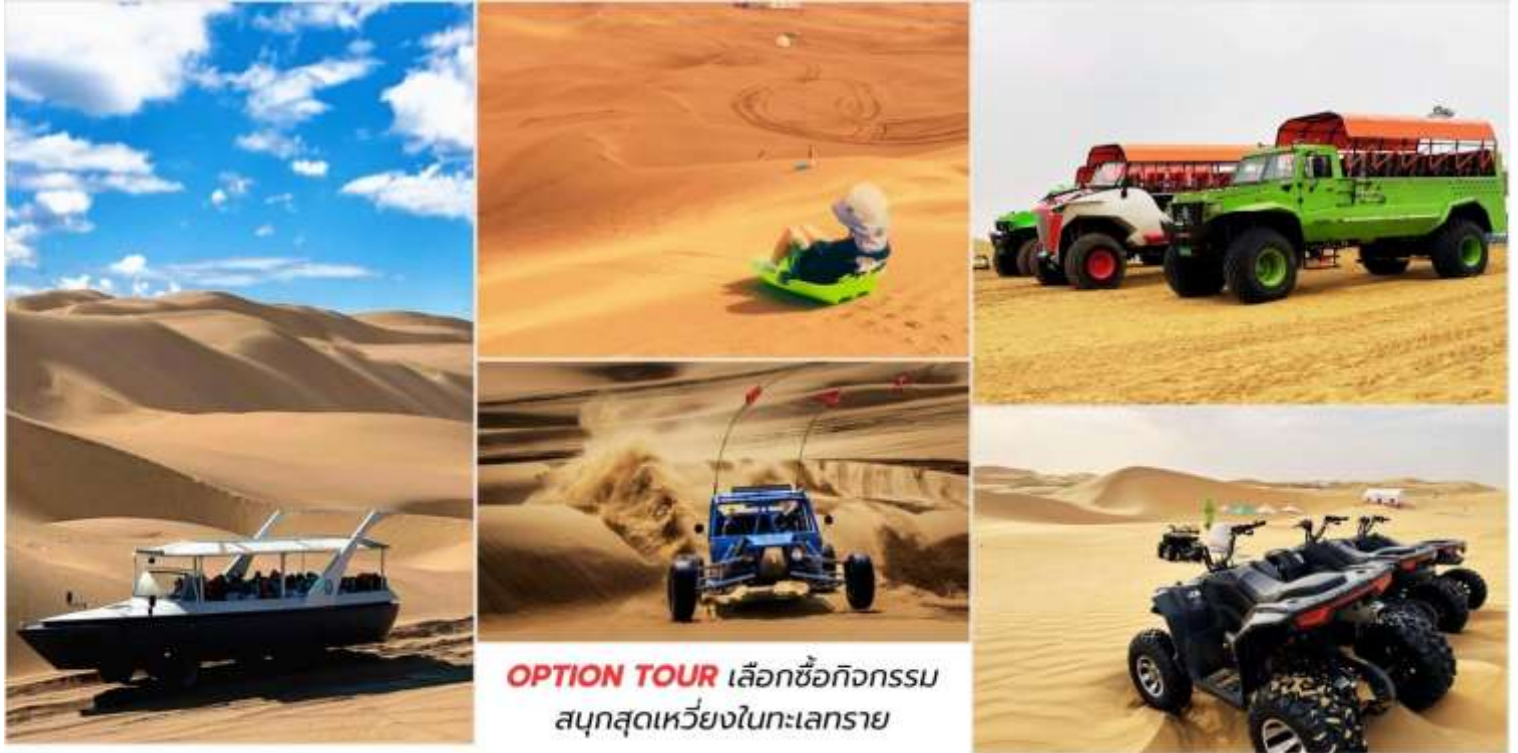
OPTION TOUR เลือกซื้อกิจกรรม สนุกสุดเหวี่ยงในทะเลทราย