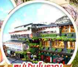
หมู่บ้านโบราณ จิวเฟิน