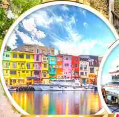
ท่าเรือสายรุ้ง