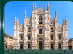
เซ็คชิน มหาวิหารดูโอโม มิลาน