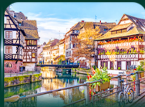
เทียวัลซาซ สตราสบูร์ก