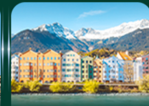
อาคารสีลูกกวาด อินส์บรุค