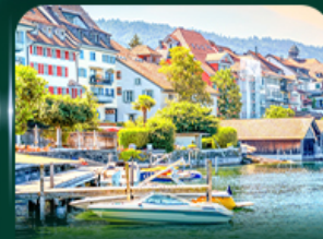
เมืองสวยริมทะเลสาบ ชุก