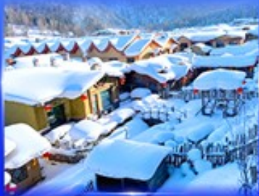
หมู่บ้านหิมะ สโนว์ทาวน์