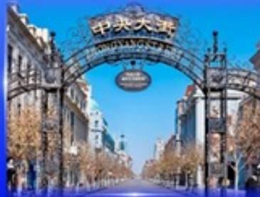
ย่านจงหยาง สตรีท