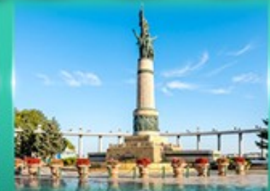
อนุสาวรีย์นิ่มพ