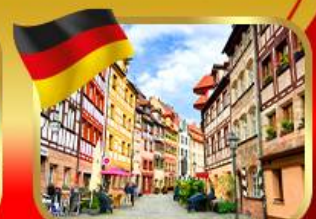
เที่ยวย่านเมืองเก่ามูเรมเบิร์ก