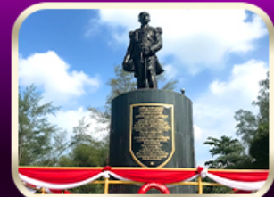
อนุสาวรีย์กรมหลวงชุมพรฯ