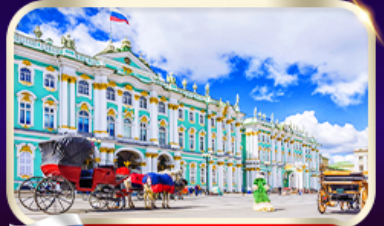
พิพิธภัณฑ์ฮอร์มิก