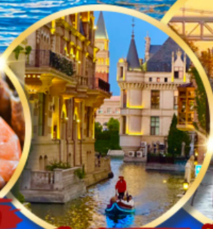
เมืองน้ำเวนิส