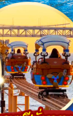
แถมฟรีนั่งรถราง