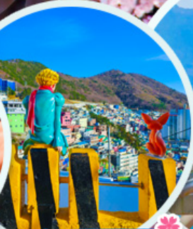
หมู่บ้านคัมซอน