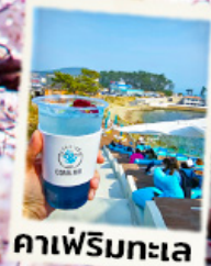
คาเฟ่ริมทะเล