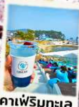
คาเฟ่ริมทะเล