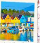
ท่าเรือสีส้ม