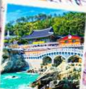
วัดริมทะเล