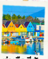
ท่าเรือสีสัน