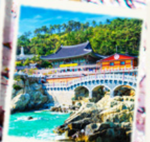
วัดริมทะเล