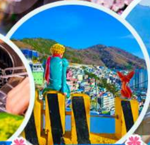
หมู่บ้านคัมซอน