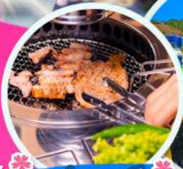
หมูย่างเกาหลี