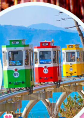
นั่งรถไฟปู๊กบ๊ิก