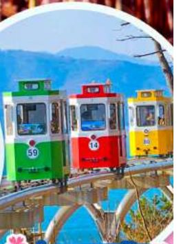
นั่งรถไฟปูกบิก