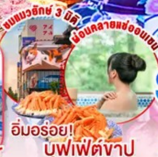
อัมมอ้อย! บุฟเฟ่ต์งาปู

ไฮไลท์!! ชมซากุระบานสะพรั่ง ณ ศาลเจ้าเก่าแก่ใจกลางกรุงโตเกียว ย้อนยุคไปกิน ถนนเม็นโซเก็น นากามิสะ ถนนสายช้อปปิ้งบนเกาะโอโนะชิมะ ชมดอกซากุระ ณ หมู่บ้านโอชิโมะฮักโกะ วิวภูเขาไฟฟูจิสีขาวตัดกับพื้นหลังสีฟ้า จุดชมวิวฟูจิ FUJIYAMA TOWER หอคอยชมวิวสวนสนุก Fuji-Q Highland ช้อปปิ้งจุใจ โอโตะบุะ และ ซินจูกุ พร้อมเช็किन แลนด์มาร์คแห่งใหม่ แมวยักษ์ 3 มิติ