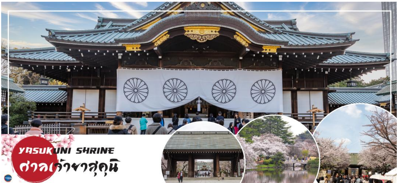
YASUKUNI SHRINE ศาลเจ้าياسุกุณี

วันที่สี่ เมืองนาริตะ – กรุงโตเกียว – ศาลเจ้าياسุกุณี (จุดชมซากุระขึ้นกับภูมิกากาศ) – ย่านโทโยสุ เซนเดย์คุ บันไร – ชมแมวยักษ์ 3 มิติ พร้อมช้อปปิ้ง ย่านชินจูกุ – เมืองนาริตะ