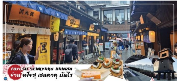
ซูชิ เทมปุระ และราเมน

นอกจากนี้ยังมีจุดออนเซ็นแช่เท้า(ฟรี) ที่ยังชมบรรยากาศของโตเกียวได้อีกด้วย