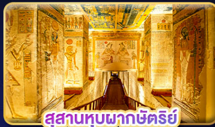
สุสานทูปพากซ์ตรีย์