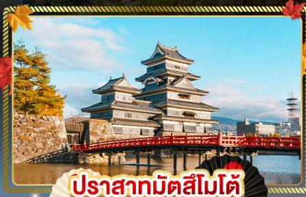
ปราสาทมิตสึโมโด้