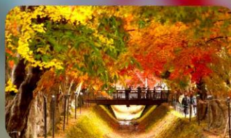
อุโมงค์เมบิซึโมจิโคโร