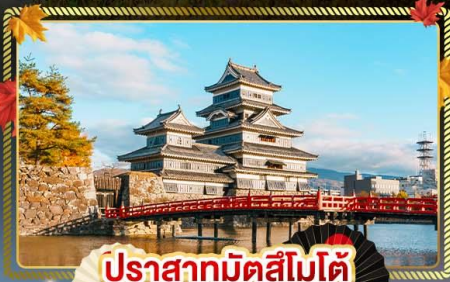
ปราสาทมัทสึโมโตะ