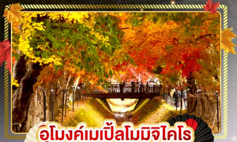
อุโมงค์เมเปิ้ลโมมิจิโคโร