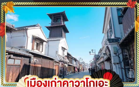
เมืองท่าคาวาโกเอะ

ชมธรรมชาติกลางหุบเขาจากแปนแอลป์ “คามิโคจิ” เที่ยวครบทุกวัน เก็บทุกไฮไลต์ คาวาโกเอะ มัทสึโมโตะ ฟุจิ