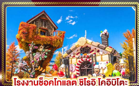
โรงงานช็อคโกแลต ชิโร โคะบิตะ