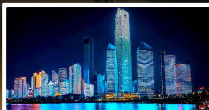
หาดไซเบอร์ฟิงก์