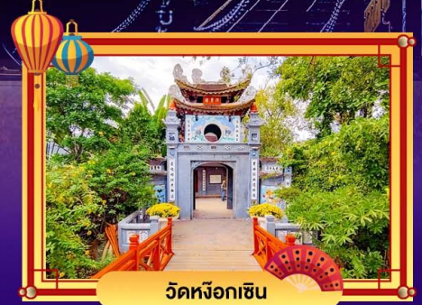
วัดหังอกเซิน