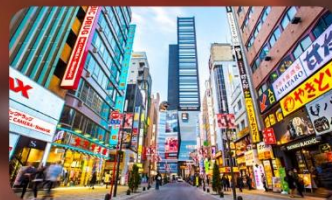
ซ้อปบั้งชินจูกุ