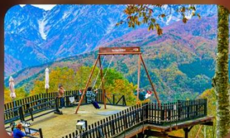
ฮาคุบะอิวาทากะ