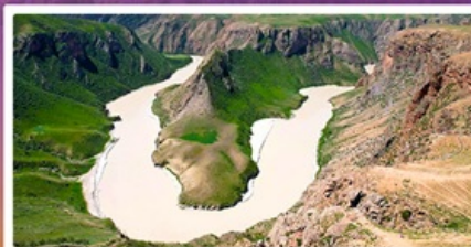
แกรนด์แคนยอนดูซานจื่อ