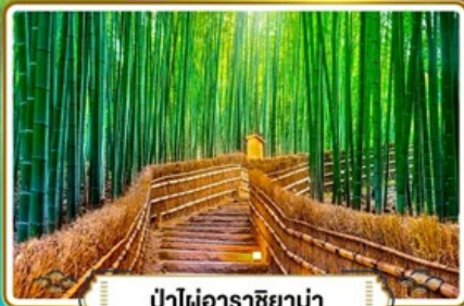
ป่าไผ่อาราชิม่า