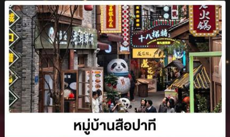
หมู่บ้านสี่牌坊