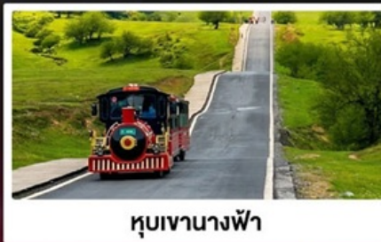
หุบเขานางฟ้า