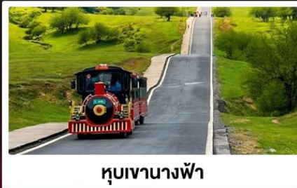
หุบเขานางฟ้า