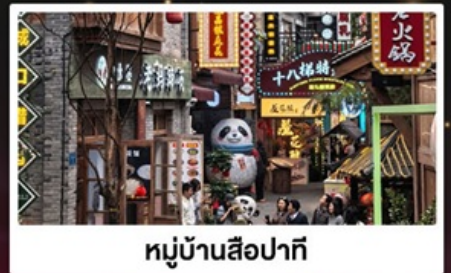
หมู่บ้านสี่牌坊