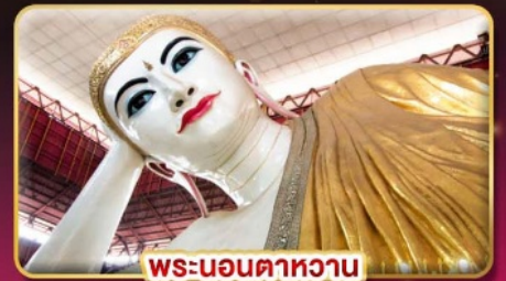
พระนอนตาทหวาน