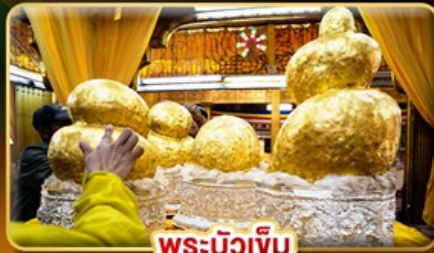
พระบิวเข้ม